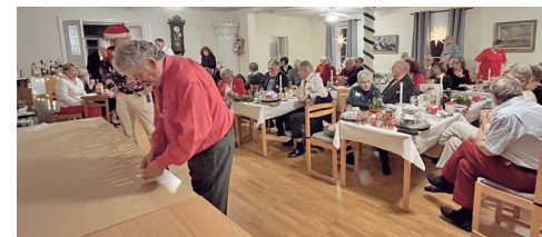
6Bild 4878: Närvarolotteriet planeras.