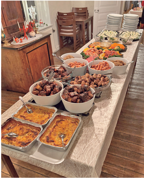
8Bild 4915: Julbordet.