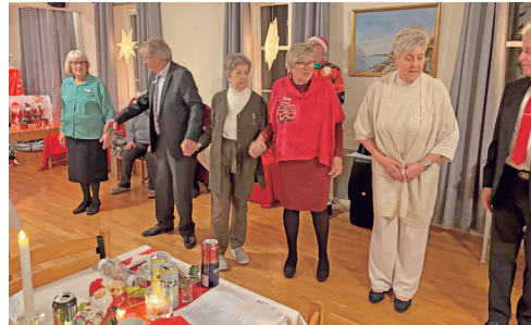
Bild på styrelsen.