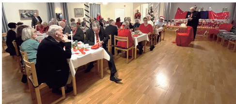
Bild på alla borden då vår DD tackar för det gångna året.