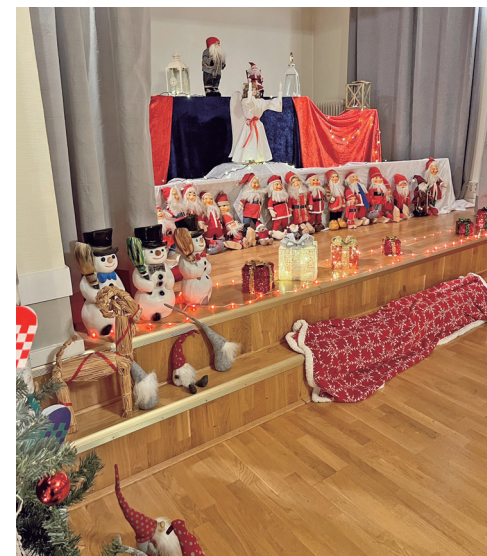
Tomteparad på scenen.