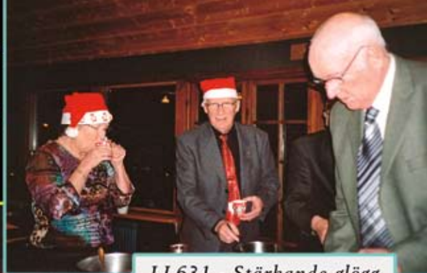
LL631 - Stärkande glögg