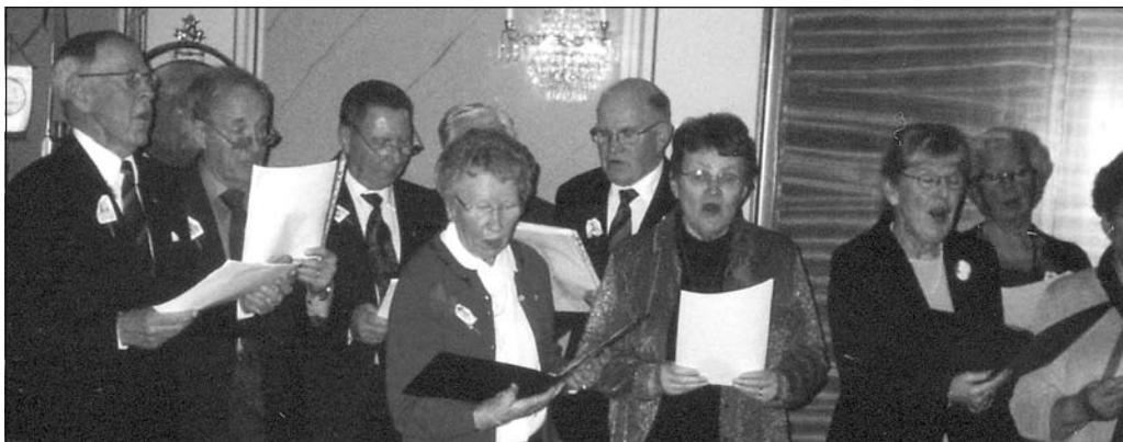
C4 Singers sjunger