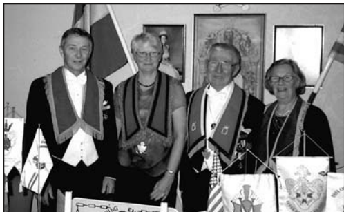
Ordförande med gäster