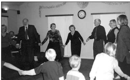
Långdans med gammal och ung

sen kom vår egen tomte med paket och got-