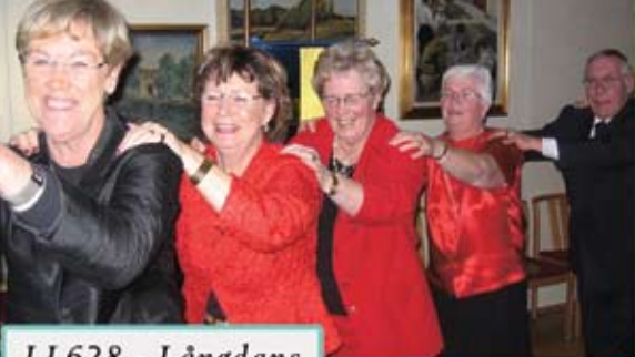
LL628 - Långdans