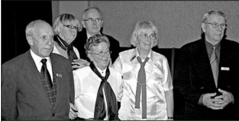
Högtidsmötet den 7 oktober arrangerades av denna grupp