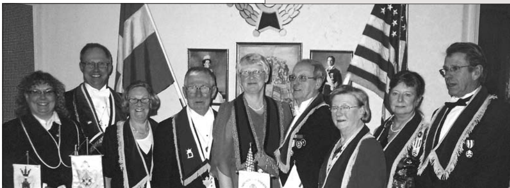
Ordförande och installationsstab

Lördagen den 10 februari var det dags för högtidsmöte med installation av Logens om-