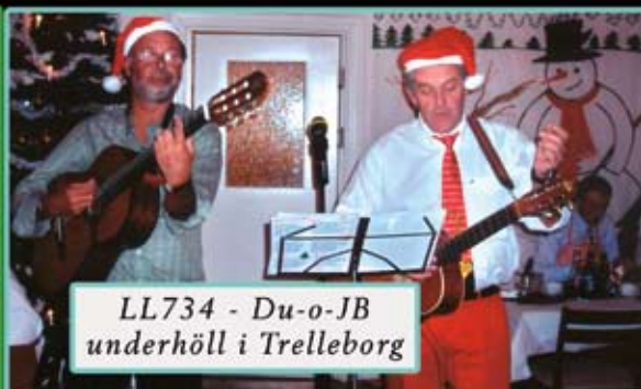
LL734 - Du-o-JB underhåll i Trelleborg