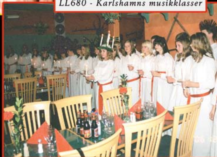
LL680 - Karlshamns musikklasser