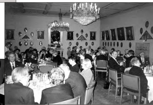
Några av de många deltagarna i Logen Carlskronas logemöte i Frimurarehuset.