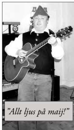
"Allt ljus på majj!"

Därefter inledde Lucia med tärnor från Kommunala musikskolan julfesten och rörde allas hjärtan med sin vackra sång. På det framdukade julbordet saknades ingenting denna kväll och magen fick mer än nog av sitt. Örongodis i form av alla de välkända och