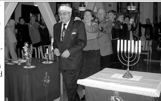
Långdans hos Calmare Nyckel Nr 628

Hösten omfattade fyra logemöten inklusive högtidsmöte. /BKL M.B.