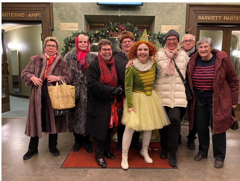
Nästan hela gänget samlades i foajén efter föreställningen och lyckades haffa en av skådespelarna att vara med på bild.