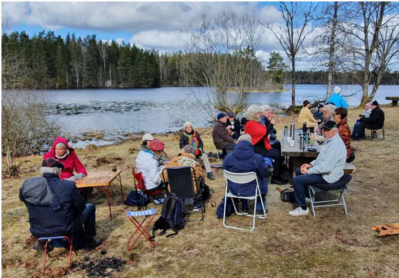
Halvvägs på vår promenad rastade vi vid en vacker sjö.