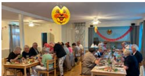
Äter vår medhavda maträtter.