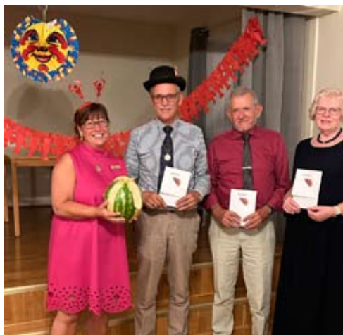
Vinnaren på tipspromenaden.