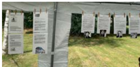
Artiklar om Svensk-Amerikaner