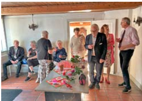
Mingel i förrummet efter tipsrundan.