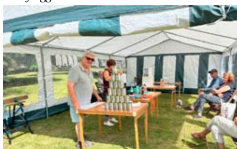
Förberedelser i tältet