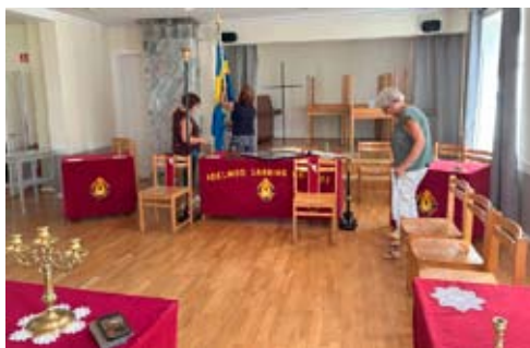
Förberedelser - Logeuppsättning