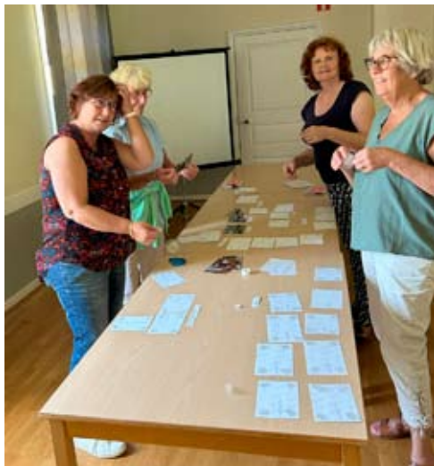
Förberedelser - Fotocollage