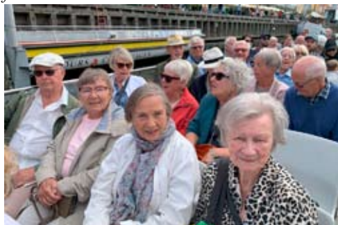
Båttur i hamnen i Köpenhamn.