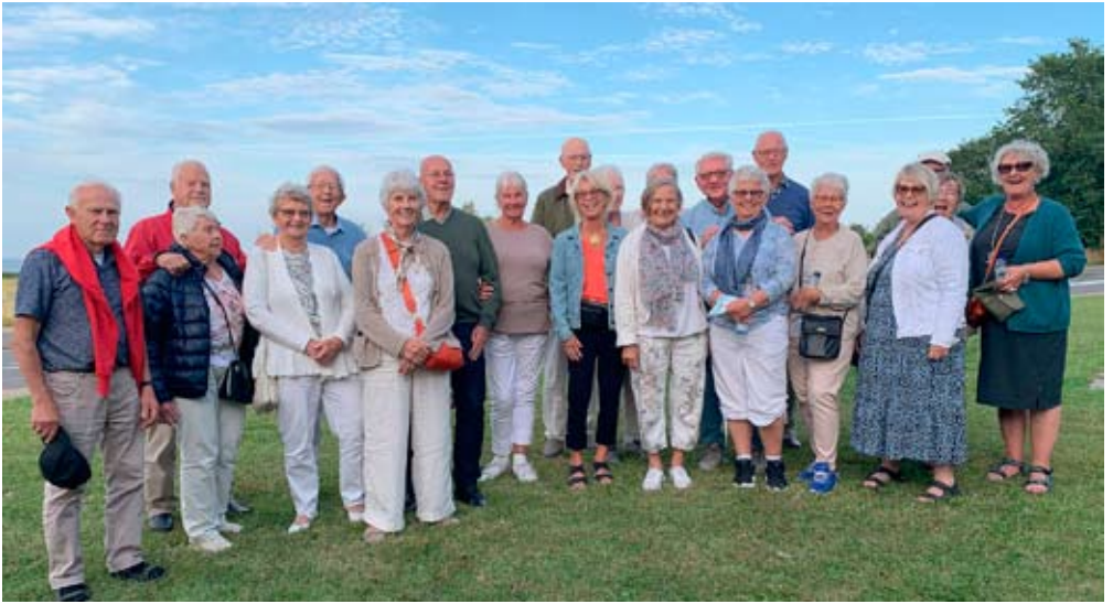
Hela det glada gänget före hemfärden.