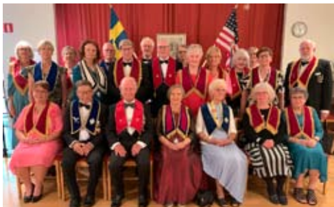
En del av gästande Ordenssyskon.