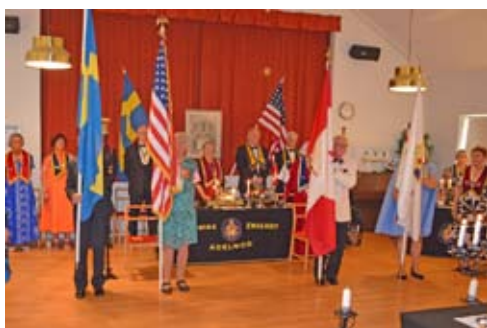
Den högtidliga fanparaden.