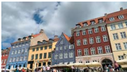
De färgglada husen i Nyhavn.