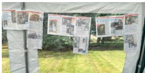
Artiklar om Svensk-Amerikaner