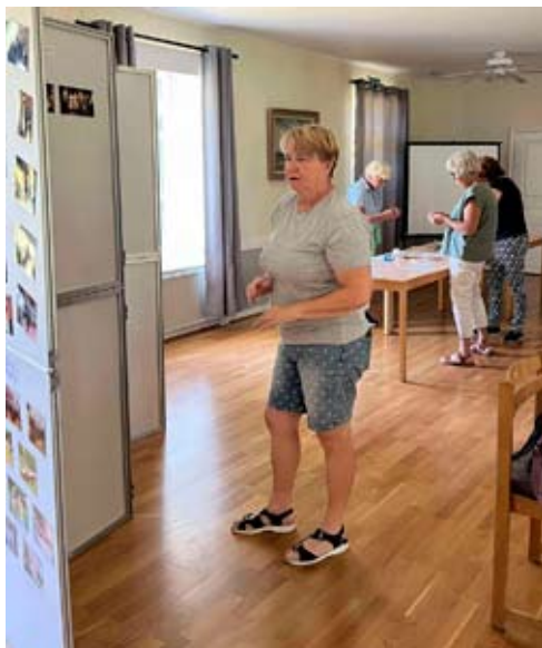
Uppsättning av fotocollaget