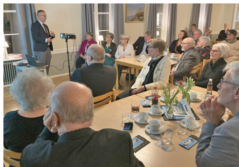
Bankmannen talade till logens medlemmar.