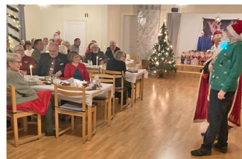
Tomtemor och tomtefar med logesyskon.