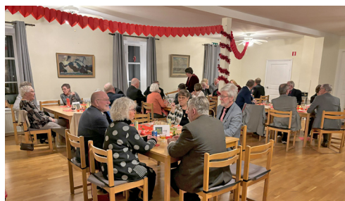
Bilderna ovan från januarimötet.