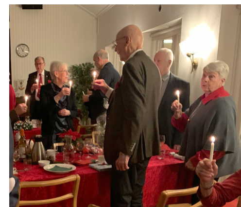
Den stämmingsfulla avslutningen.