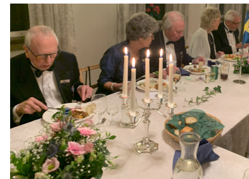
Det vackert dukade honnörsbordet.