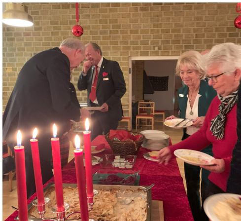
Samling kring julmaten.

tades med att vi tände var sitt ljus och sjöng "Nu tändas tusen Juleljus" och önskade varandra en riktigt god och skön julhelg.