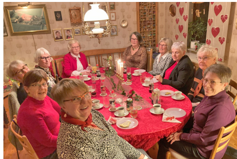
Samvaro efter adventsgudstjänst.