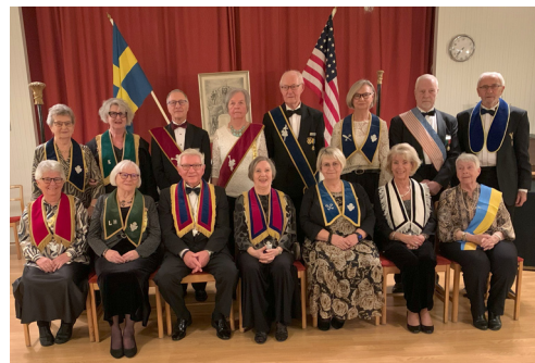
De nyinstallerade tjänstemännen.