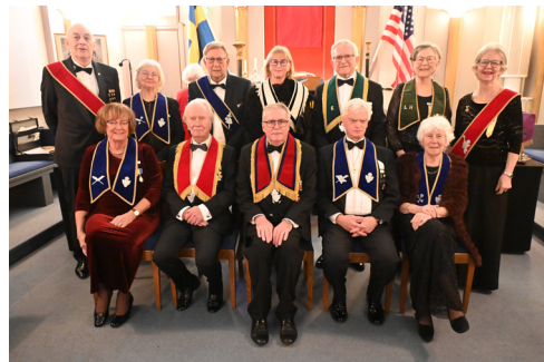
De nyinstallerade tjänstemännen.