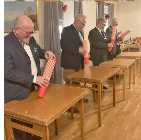
Från brödernas tävlingsmoment.