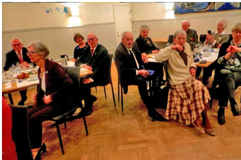
Samling vid föredraget.