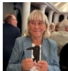
13 presidentval i USA. 1996 mottog hon stora journalistpriset. Fyra medlemmar från Logen Lidköping nr 636