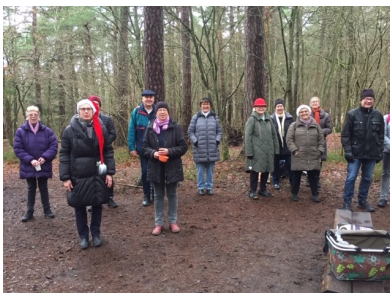
15 december 2020