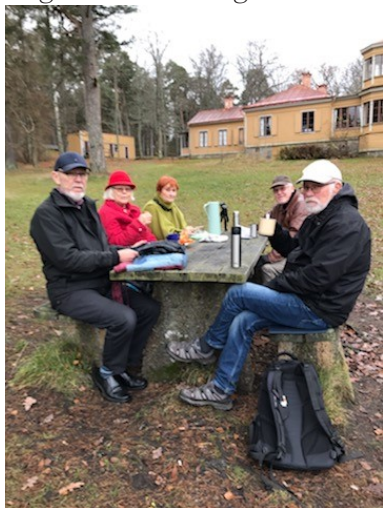
17 november 2020

Abborreberg började byggas på 1810-talet av textilfabrikör Christian Lenning. Abborreberg är vackert belägen med