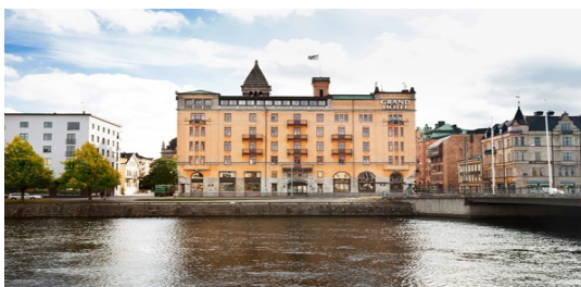
Elite Grand Hotel Norrköping