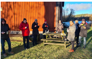
12 januari 2021