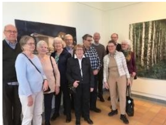
Logen Kongahälla på Lerinutställningen