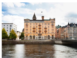
Elite Grand Hotel Norrköping

Distriktsloge Norra Sverige nr 19 vill tacka för allt gott samarbete under detta mycket märkliga år.