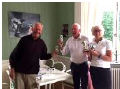
Pristagare i Golftävlingen

för hur och när kontakter tas men som organisation kan vi inte ta det fulla ansvaret för våra medlemmar. Förhoppningsvis kan årsmötet 2021 hållas på ett säkert sätt.