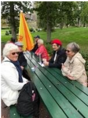
Glasspaus Bohus fästning