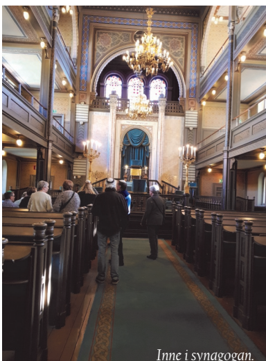
Inne i synagogan.

Efteråt gick några av oss och åt en god kycklingsoppa med en tillhörande tårtbuffé.