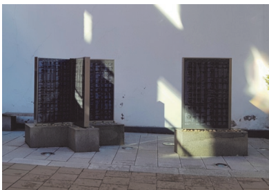
Minnesdokumentet i form av bok.

Synagogan är byggd år 1855 och ligger i anslutning till församlingshuset. Den rymmer 300 sittande och har en Marcussenorgel som används vid konserter.